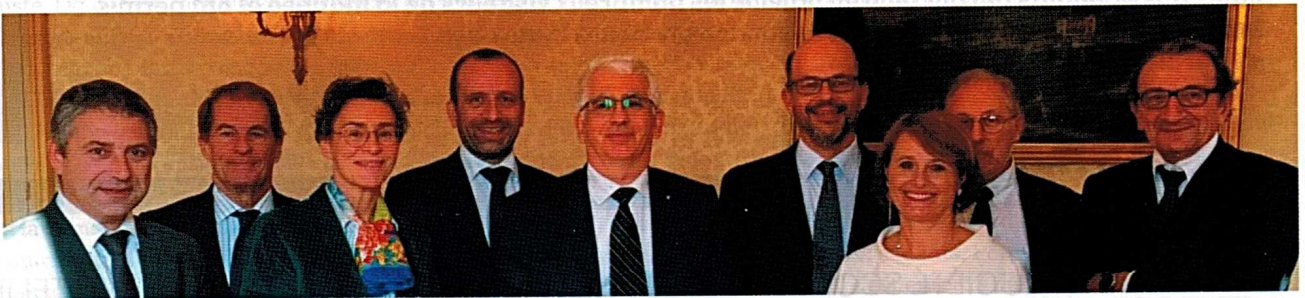
Membres du Conseil d'Administration